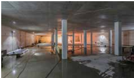
De komende maanden werkt de aannemer verder aan de binnenzijde van de fietsenkelder.

geval de komende tientallen jaren onttrokken aan het zicht! Aannemer K_Dekker bouw & infra bracht dakbedekking aan met daarover een zandlaag (foto voorkant). De damwanden langs de rijbaan zijn deels "afgebrand" en uit de grond gehaald. Het met oranje plastic ingepakte deel op de foto wordt straks de extra in- en uitgang voor voetgangers.