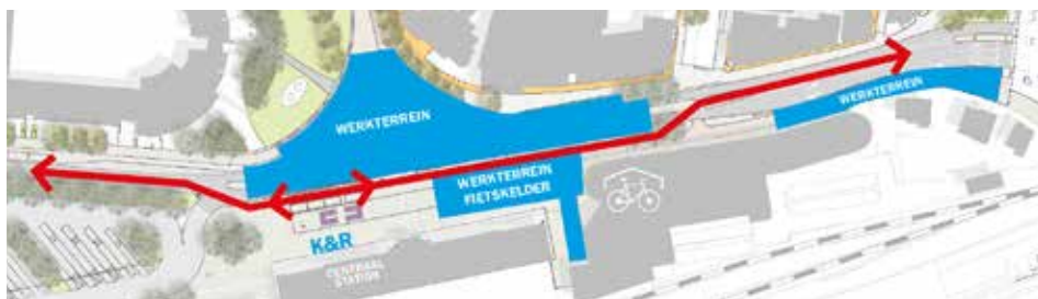
Er komt een tijdelijke weg, zo kan het verkeer langs het werk rijden.

Over het dak van de fietsenkelder legt de aannemer vanaf maandag 24 juli een tijdelijke weg. Deze gaat een week later op maandag 31 juli open. Dan ontstaat er ruimte om de Stationsweg tussen het stationsplein en het plantsoen opnieuw in te richten. Voetgangers van en naar het station worden door het werkgebied geleid. De tijdelijke weg is ongeveer acht weken in gebruik, daarna kan het verkeer over de nieuwe weg rijden. In de volgende fase is de rest van de Stationsweg aan de beurt.