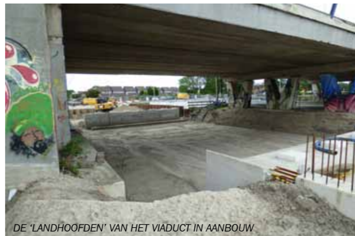
DE 'LANDHOOFDEN' VAN HET VIADUCT IN AANBOUW