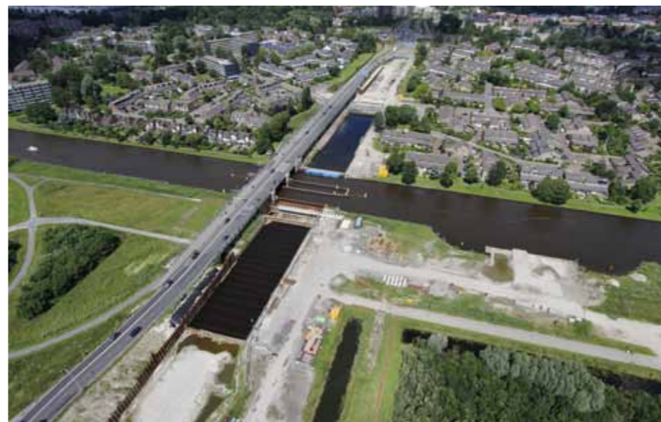
LUCHTFOTO VAN HET AQUADUCT IN AANBOUW - BEGIN JULI 2015

Sinds begin dit jaar speelden diverse problemen bij het bouwproces van het M.C. Escher Akwadukt in de Drachtsterweg. De afgelopen periode voerden de partijen gesprekken om tot overeenstemming te komen zonder tussenkomst van een rechter. Dit alternatief zou tot veel meer onzekerheid over budget en planning leiden.