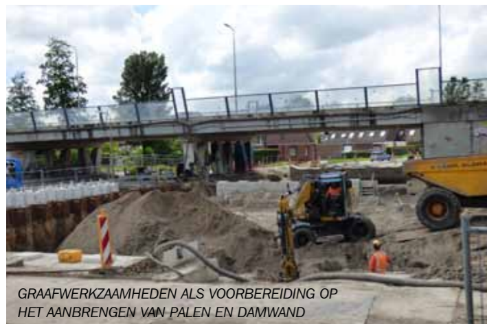
GRAAFWERKZAAMHEDEN ALS VOORBEREIDING OP HET AANBRENGEN VAN PALEN EN DAMWAND

ven maken van de Weideflora-Stinzenflora. Wel is er vanaf januari 2017 een hoogtebeperking van 2,60 meter. Deze is van kracht totdat de Drachtsterbrug gesloopt is (najaar 2017).