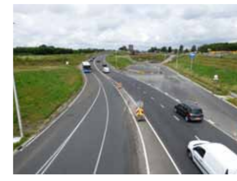
DE TOERIT AAN DE ZUIDZIJDE (STRAKS GAAT HET VERKEER RECHTDOOR RICHTING AQUADUCT)