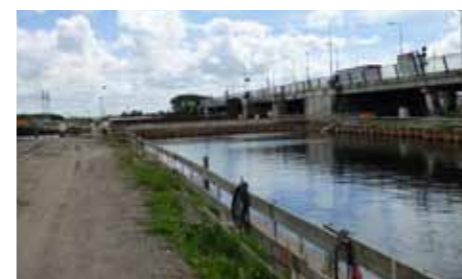
DE TOERIT AAN DE NOORDZIJDE