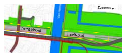
DE TOERITTEN AAN DE NOORD- EN ZUIDZIJDE VAN HET AQUADUCT

bouw van de toeritten worden waar mogelijk gedrukt in plaats van getrild. Hierbij is er minder geluidsoverlast en minder kans op schade. Momenteel wordt een proef gedaan om deze methode te testen. Als drukken niet lukt wordt er gekeken naar alternatieven met minder geluidsoverlast en minder kans op schade.